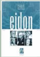
EIDON Nº 8