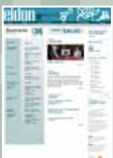
EIDON Nº 36