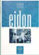
EIDON Nº 1