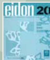
EIDON Nº 20