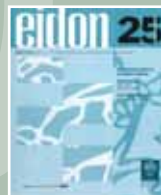
EIDON Nº 25