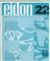
EIDON Nº 22