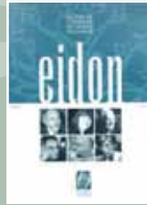
EIDON Nº 7