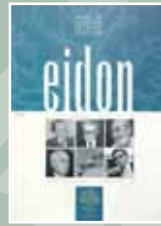
EIDON Nº 12