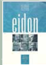
EIDON Nº 10