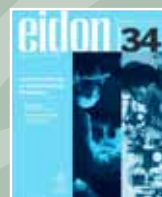
EIDON Nº 34