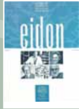
EIDON Nº 4