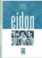
EIDON Nº 6