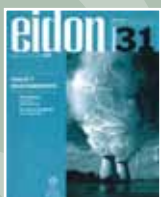
EIDON Nº 31