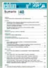
EIDON Nº 40