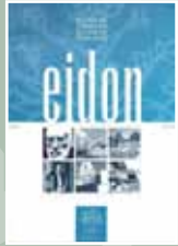
EIDON Nº 0