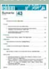
EIDON Nº 43