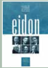
EIDON Nº 9