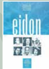
EIDON Nº 11