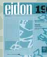
EIDON Nº 19