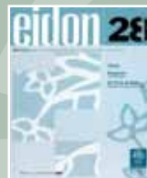
EIDON Nº 28