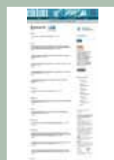
EIDON Nº 49