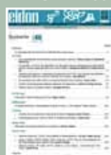
EIDON Nº 46