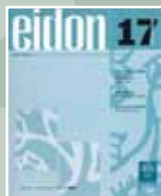
EIDON Nº 17