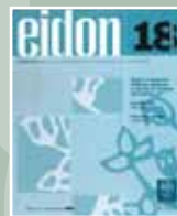
EIDON Nº 18