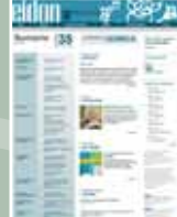
EIDON Nº 35