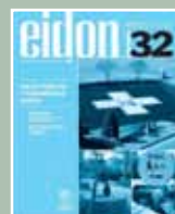
EIDON Nº 32