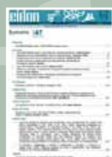
EIDON Nº 47