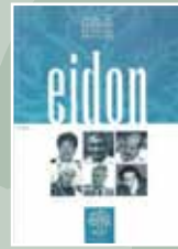
EIDON Nº 13