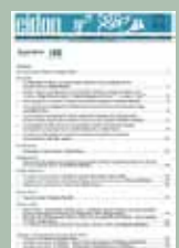
EIDON Nº 48