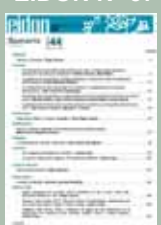
EIDON Nº 44