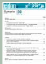
EIDON Nº 39