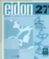
EIDON Nº 27