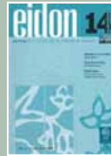
EIDON Nº 14