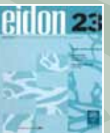
EIDON Nº 23