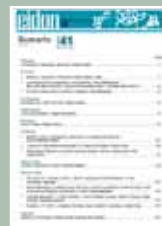
EIDON Nº 41