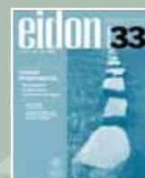
EIDON Nº 33