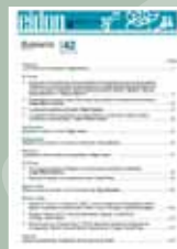
EIDON Nº 42