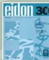
EIDON Nº 30