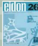
EIDON Nº 26