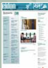
EIDON Nº 38