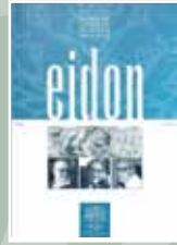
EIDON Nº 5