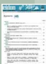
EIDON Nº 45