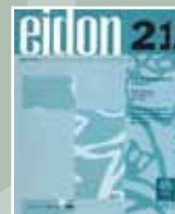
EIDON Nº 21