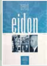
EIDON Nº 3