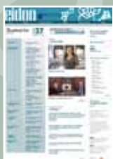
EIDON Nº 37